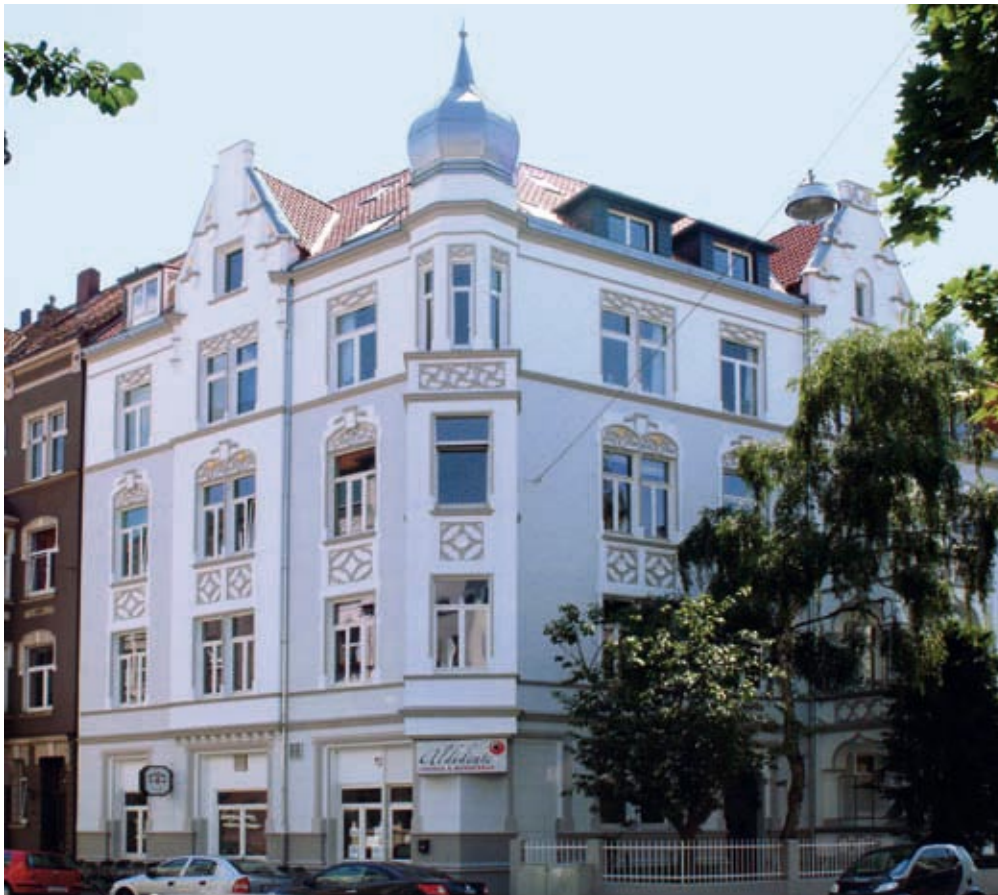
Preisgekrönt: Der sanierte Prachtbau aus Hannovers Südstadt

Zum 5. Mal in Folge lobten die Haus & Grund Hannover und die Maler- und Lackiererinnung Hannover einen Fassadenwettbewerb aus. Eine unabhängige Jury, die sich aus den beteiligten Institutionen und Sponsoren zusammensetzte, ermittelte insgesamt drei Preisträger. Der erste Preis für die Sanierung eines